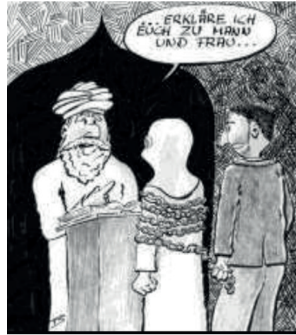
Resim 1 ve 2: Alman karikatürlerinde İslamofobi örnekleri

İslamofobinin kendini gösterdiği bir diğer alan ise bilgisayar oyunlarıdır. Hızla değişip gelişen dünyada teknolojinin ilerlemesi, internet ve bilgisayar oyunlarının yaygınlaşmasıyla beraber İslamofobi bu alanda da kendine yer bulmuştur. Özellikle çocuklar ve gençlerin rağbet ettiği bu oyunlar, oyunu üreten kişinin ideolojisini taşıdığı için, içerisinde İslamofobiyi barındıran grafiklerle, görsellerle donatılmaktadır. Kullanıcılara açıkça belli edilmeden hazırlanan içerik, bireyin bilinçaltı dünyasına seslenerek kişinin kavramsal dünyasına saldırmaktadır. Yani oyunda bir karakteri yönlendiren kullanıcının zihin dünyasında var olan ve kendi için önem atfeden her görsel, oyun içerisinde başka bir görsele benzetilerek yok edilmekte ve bunu kullanıcı farkında olmadan yapmaktadır. 11