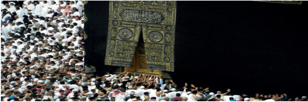
Resim 4: Müslümanlarca kutsal kabul edilen Kâbe'ye ait bir görüntü

Örneğin, resim üçte yer alan 'Devil My Cry' adlı oyunda, kullanıcının yönlendirdiği karakter resimdeki kapının önüne gelir. Bu kısım oyunun hikâyesinde kötü güçlere ait mekân olarak tasvir edilir ve görseldeki kapı, şeytani güçlerin girip çıktığı bir yerdir. 12 Oyundaki kapı normal işleme desenli bir kapı gibi gözükse de dikkat edildiğinde açıkça Kâbe örtüsüne benzetildiği görülmektedir.