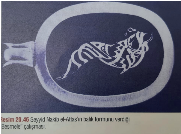
Resim 20.46 Seyyid Nakib el-Attas’ın balık formunu verdiği Besmele” çalışması.

Günümüz dünyasında sanat alanında yaşanan bazı değişimler kendisini İslam sanatlarında da hissettirmiştir. Bu değişiklikler genelde Batı medeniyetinin sanat alanında sahip olduğu temel sâiklerin İslam sanatlarına kanalize edilmesiyle gerçekleşmiştir. Bu bağlamda hat sanatının sahip olduğu tevhid ve ulûhiyet eksenli mistik mana korunmaya çalışılmış; hattın uygulanış biçimi ve şeklinde ise farklılığa gidilmiştir. Bu teşebbüs sonucunda hat sanatındaki eğilimler “Geleneksel”, “Şekli (figüral)”, “Ekspresyonist (anlatımcı)”, “Sembolik” ve “Saf Soyutlamacı” şeklinde sınıflandırılabilir.