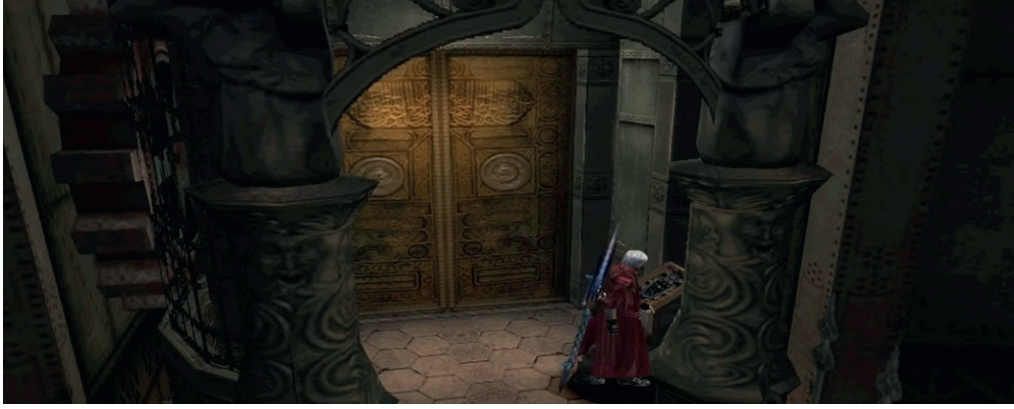
Resim 3: 'Devil My Cry' adlı oyun

Örneğin, resim üçte yer alan 'Devil My Cry' adlı oyunda, kullanıcının yönlendirdiği karakter resimdeki kapının önüne gelir. Bu kısım oyunun hikâyesinde kötü güçlere ait mekân olarak tasvir edilir ve görseldeki kapı, şeytani güçlerin girip çıktığı bir yerdir. 12 Oyundaki kapı normal işleme desenli bir kapı gibi gözükse de dikkat edildiğinde açıkça Kâbe örtüsüne benzetildiği görülmektedir.