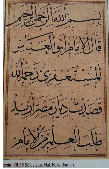
Resim 20.28 Sülüs yazı. Hat: Hafız Osman.

İbn Mukle ve İbnü'l-Bevvâb ile başlayan hatta kimlik kazan- dırma çabaları, Yâkût b. Abdullah el-Müsta'simî (ö.698/1298)'nin geliştirdiği yeni metotla birlikte bambaşka bir soluk kazanmıştır. Öyle ki Yâkût b. Abdullah el-Müsta'simî, ilk defa kamış kalemin ucunu günümüzde kullanıldığı şekliyle kesen kişi olarak bilinir ve dönemin revaçtaki Aklâm-ı Sittesi'ni ortaya çıkarmasıyla tanınır.