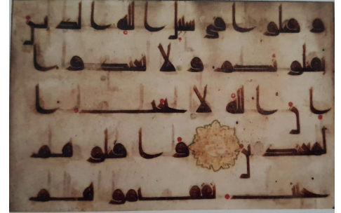
Resim 20.1 İlk Dönem Küfî örneği (Ebu'l-Esved ed-Düeli usulüyle kırmızı noktalarla harekeli).

ğer gelenekli sanatlarla da bir etkileşim içerisine girmiştir. Miladi yedinci yüzyılda Arap yarımadasında yaşayan halkın yazıyla olan iletişimi yapılan arkeolojik kazılarda ortaya çıkmış; parşömen ve papirüs türüvi kâğıtlarda bu iletişimin izlerine rastlanmıştır. 3 Hz. Peygamber (s.a.s) Dönemi'nde ise ashabin okuma ve yazma kabiliyetine sahip olduğu ve nazil olan ayetlerin kürek kemikleri, hurma dalları ve beyaz taşların üzerine yazılmak suretiyle kayda alındığı bilinmektedir. Birlikte daha çok şifahî kültür ile malûmatın muhafazası sağlanmıştır. 4 Fakat Hz. Peygamber'in (s.a.s) ve daha sonra savaşlarda pek çok hafızın vefat etmesi sebebiyle Kur'an ayetlerinin kaybolmaması adına Hz. Ebubekir (r.a.) Dönemi'nde Zeyd b. Sabit (r.a.) başkanlığında Kur'an ilk olarak kitap hâline getirilmiştir. Akabinde Hz. Osman (r.a.) Dönemi'nde Zeyd b. Sabit'in (r.a.) hazırladığı nüsha Kureyş lehçesi ile tekrar yazılmış ve yedi büyük ilin valisine birer kopya gönderilmiştir. Yapılan bu istinsah faaliyeti, berabe-