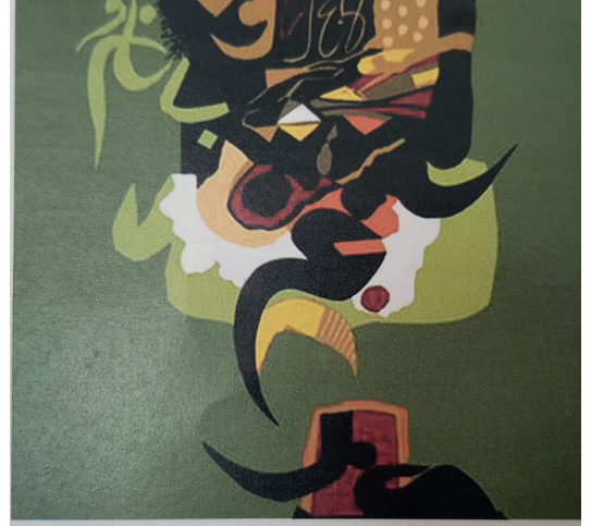
Resim 20.42 İraklı sanatçı Ziya el-Azzâvî'nin bir çalışması.

“Saf soyutlamacı” veya “sözde hat sanatında” ise harfler, taşıdıkları geleneksel anlamdan soyutlanmış olarak tamamen estetik bir kaygıyla düzenlenir. Saf soyutlamacı hat tatlara, harfleri üstün bir mesajın parçaları olarak görmek yerine işlenmesi gereken şekiller olarak görürler. 13 Dolayısıyla tevhid ve ulûhiyet fikrinden yoksun olan bu sanat akımı İslam sanatının ruhuna uygun olmayan bir yapıya sahiptir.