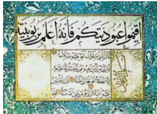
Şeyh Hamdullah’ın Muhakkak-reyhânî kıtası (TSMK, Emanet Hazinesi, nr. 2084)